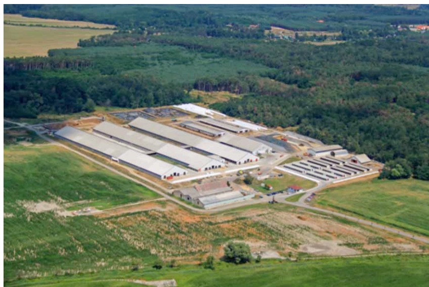
Melkveebedrijf van First Farms in Plavecky Stvrtok, Slowakije.

First Farms bezit en exploiteert Landbouw- en melkveebedrijven. In Slowakije wordt door het bedrijf sinds 2012 met 2.600 melkkoeien ongeveer 24.700 ton melk per jaar geproduceerd. First Farms heeft nu de zuivelverwerker Fude + Serrahn voor lange termijn gecontracteerd als vaste afnemer voor al haar melk. De afnameprijs is gebaseerd op wat een groep van zuivelcoöperaties in Duitsland betalen aan hun melkleveranciers. Deze onherroepelijke overeenkomst is gunstig voor beide partijen. Voor First Farms is het grote voordeel dat het voor lange tijd de afzet van haar melk garandeert, tegen een redelijke prijs.